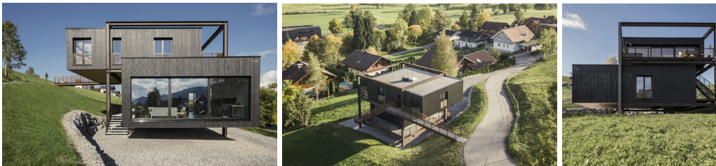
HAUS M, ALBERSCHWENDE, AT BÜRO BAUMSCHLAGER HUTTER