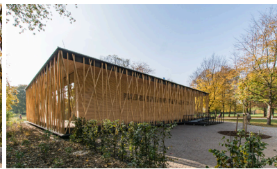
UMWELTBILDUNGSZENTRUM BRITZERGARTEN, BERLIN BÜRO HK ARCHITEKTEN