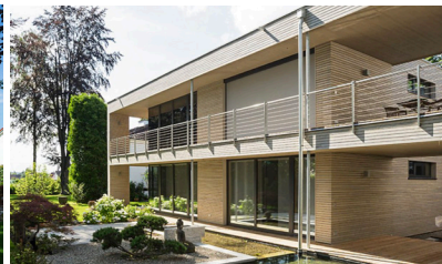
SENIORENOASE WEISSENHORN, AT BÜRO HK ARCHITEKTEN