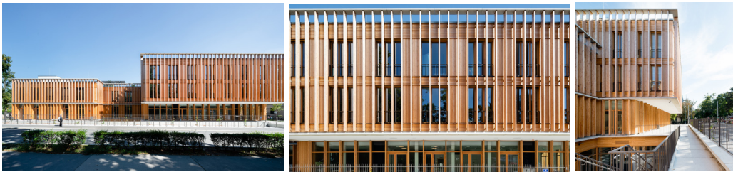
TÜRKENWIRT GEBÄUDE DER UNIVERSITÄT FÜR BODENKULTUR WIEN, AT BÜRO BAUMSCHLAGER HUTTER